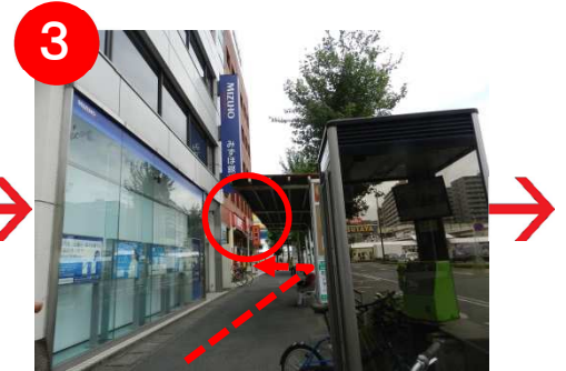
突き当りに「吉野家」があります。吉野家を左に曲がります。