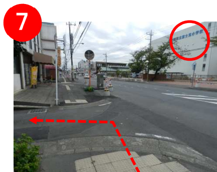
100mほど先右手に「上尾市立富士見小学校」が見えます。その手前の道を左折します。