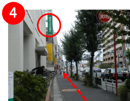
「埼玉りそな銀行」が見えます。そのまま直進します。