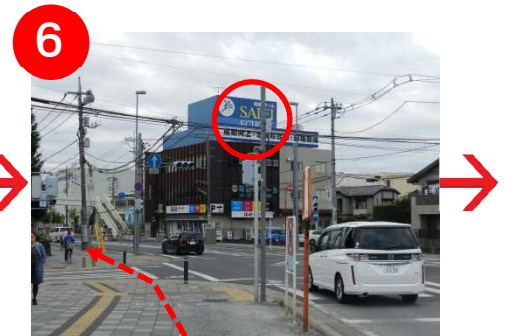
さらに 200mほど進むと、「SAIJI 塾」が見える交差点があります。直進です。