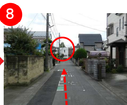
50m直進します。前方に教会が見えてきました。