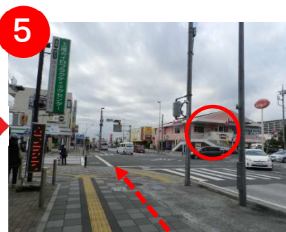
200mほど進むと、右手に「ジョナサン」の見える交差点があります。直進します。