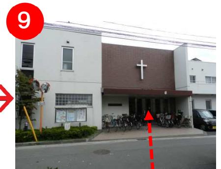
正面入り口よりお入りください。