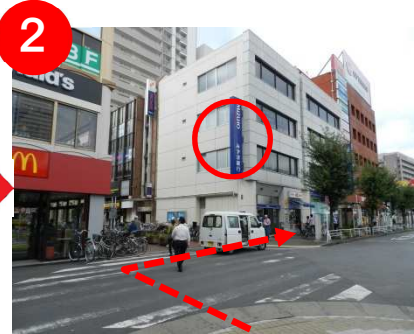
エイブルの建物(1Fがマック)を右に曲がり、「みずほ銀行」前を通り過ぎます。